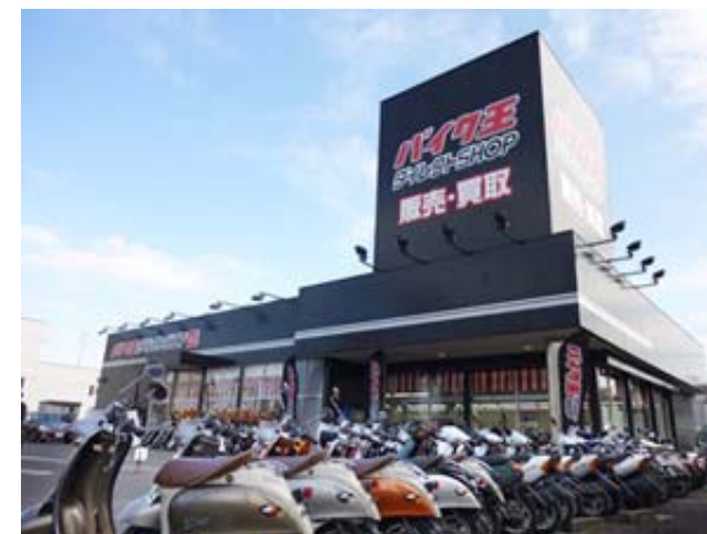
【バイク王ダイレクトSHOP16号相模大野店】