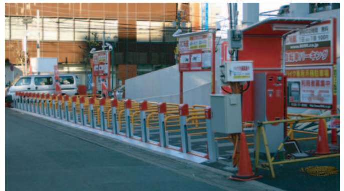
■パーク王相模原第三橋本駐車場

パーク王はこのほか、「下丸子」駅前に開設したパーク王大田第二下丸子駐車場を含む4事業地に四輪車専用駐車場を設け、住宅地・商業地といった各々の地域特性に沿った運営を行うとともに、パーク王文京月極第一後楽園駐車場においては、簡易な設備ではありながらも住宅地におけるオートバイ駐車スペースの確保を可能としており、パーク王が設立時より訴求しております効率的な土地活用の手法を最大限に発揮しております。