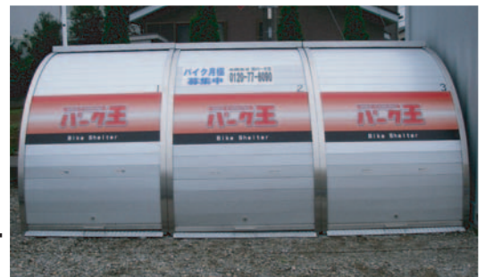
■パーク王船橋第三東船橋駐車場

「東船橋」駅まで徒歩3分の距離にオープンいたしましたパーク王船橋第三東船橋駐車場は、バイクシェルターを用いたオートバイ月極駐車場です。同エリアは、とりわけ集合住宅が多く林立する地域であり、盗難やいたずらの未然防止、ならびに住環境からくるオートバイ駐車場の確保といった側面より開設へと至りました。当事業地は、駅・住宅地域双方より近いことから、安心・安全を念頭とした営業を行ってまいります。