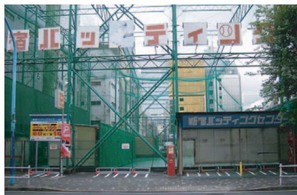
■パーク王新宿第三歌舞伎町区役所通り駐車場

パーク王は、地域特性に応じた柔軟な運営体系とユーザーの要望に応じた駐車場の展開を通して、生活者の安全かつ快適な日常空間の創出、諸交通問題の解消、オートバイを取り巻く環境の整備促進に取り組むことで、社会へ広く貢献する企業を目指してまいります。そして、当社においてもビジョンとして掲げております「オートバイライフの総合プランナー」実現に向け、一層の努力を尽くす所存です。